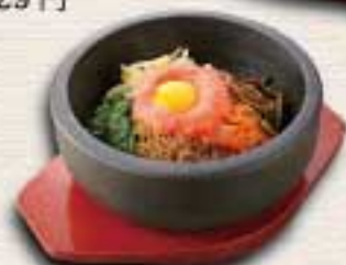
石焼き明太ビビンバ