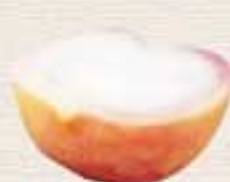
ももシャーベット