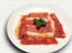
にんにく塩カルビ