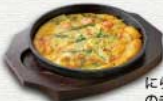
にらと海鮮のチヂミ