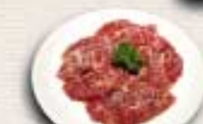
にんにく塩ハラミ