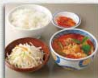
カルビスープセット