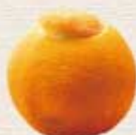
オレンジ シャーベット