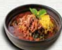
ユッケジャンスープ