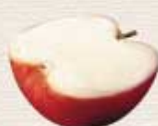
りんご シャーベット