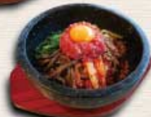
石焼きユッケビビンバ