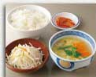
玉子スープセット