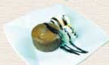
フォンダンショコラ