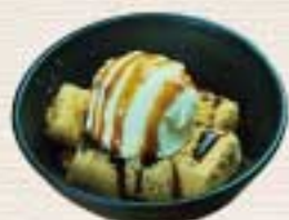
バニラとわらび餅