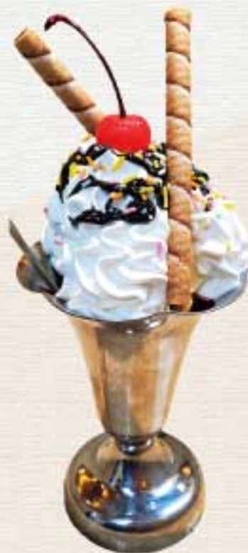
チョコレートパフェ